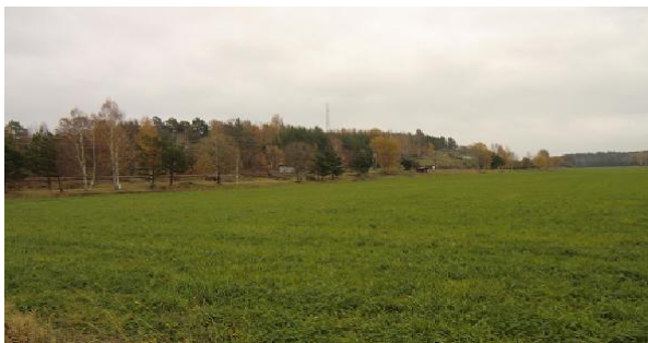
Krogplatsen sedd från f d vintervägen.

Idag, snart 250 år sedan de hästdragna slädesenärerna kunde rasta sig här, passerar dagens resande platsen i kanske 150 knyck.