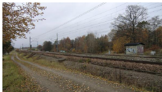
Här låg krogen. Vi får tänka bort den höga banvallen. Den tidigare landsvägen ansas bortom elhuset.