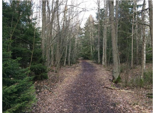
Till höger en sentida anslutningsstig.