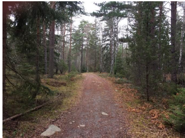
Sandtag till vänster.