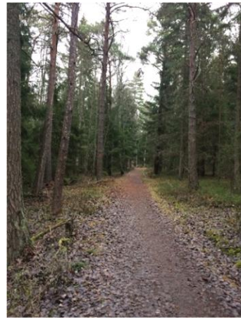
Sentida stig från vänster.