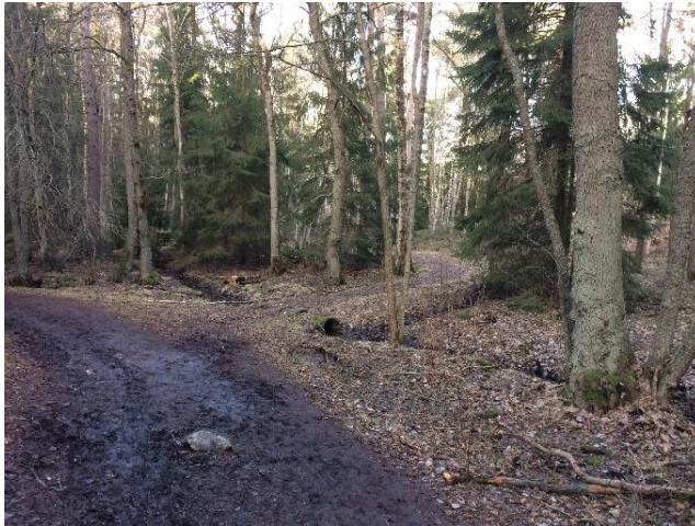
Drottning Kristinas väg fortsätter till höger.

Vägsträckan ligger i huvudsak inom naturreservatet. Den börjar vid stigdelningen strax norr Norrboda förskola. Drottning Kristinas väg fortsätter till höger. Fotograferat på ungefär var 100:e meter, 2018 och 2020.