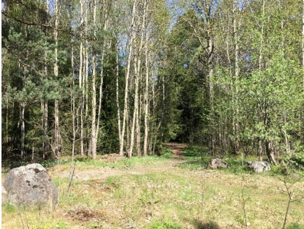
"Ingången" till Drottning Kristinas väg, sedd från Granhammarsvägen.

Denna vägsträcka ligger inom ett område som är planerat för bebyggelse. Sträckan börjar vid Granhammarsvägen och går förbi Norrboda förskola. Fotograferat söderifrån på ungefär var 100:e meter 2018-2020.