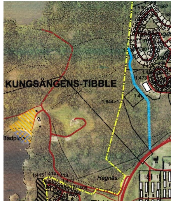
Sträckan är blåmarkerad på kartan.