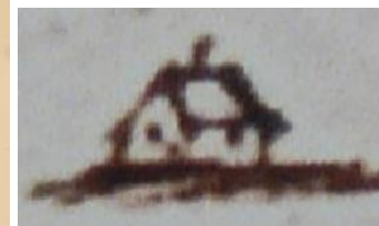
Grindtorpet enligt 1690 års karta (schablon).

Enligt 1689 och 1690 års Aspviks-kartor har Grindtorpet upptagit en vret (avsides liggande odling), eller två, och kan årligen så på 3/8 tunnland. Kartan visar att torparen hade tillgång till fyra små åkrar (bokstaven O). Den nordligaste odlingen ingår idag i koloniområdet. Odlingen intill torpet kan ännu urskiljas i terrängen. Av de södra odlingarna utgör den ena idag fastigheten Hasselbacken och den andra låg ett stycke norr ut. Den sammanlagda åkerarealen var 3/8-dels tunnland (ca 2.000 kvm). Odlingarna har efter hand utvidgats av senare brukare. Någon äng hade torparen inte men "förunnas ett stycke i herrängen" (väster om landsvägen) där säteriet hämtade sitt hö.