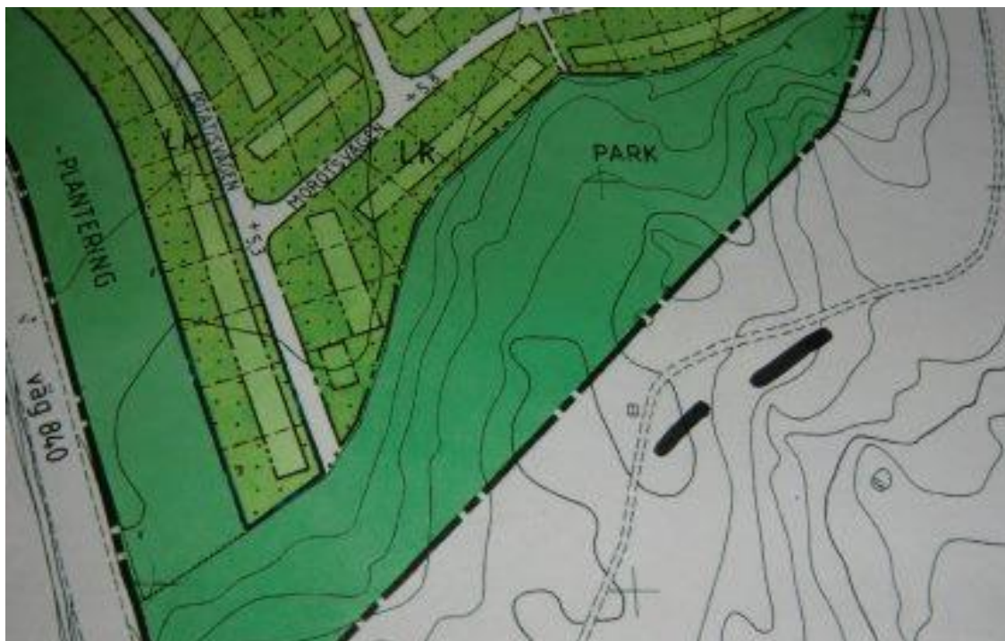
Torpgrunden är utritad intill stigen. En möjlig äldre vägsträckning (hålvägsform) har markerats av författaren.