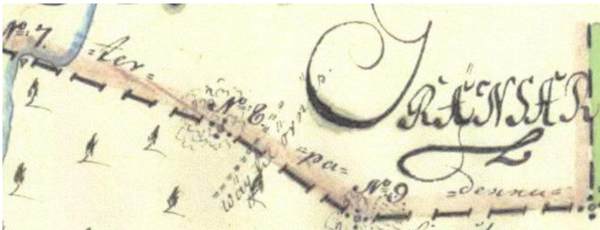
Örnäsvägröret är nr 8 på rågångskartan från 1753. Övriga gränsrösen mellan Örnäs och Tibble ägor på kartan är röse 7 är vid stranden till Örnässjön, nr 9 nära dagens Lillmossvägen 26 i Norrboda och nr 10 intill Pettersbergsvägen.